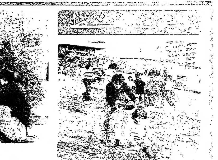
«الملك اند» امس كان نشطاً ساحلاً وجيلاً . الزهورات على الشواطئ عادت الى سابق عهدها مع جلسة عائلية وهوية وتربية . والزماجر عادت تطلق ابواقها مع موسم الاغراس . والاولاد وجندا في كل مكان مجالاً للعب والتسلية .

مؤسسة الاب اندويخ للاصماء واوليكم التلغون - ٤٢٠٧٣٥ و ٤٢٠٦٤٥ آخر موعد للتسجيل في قسم تدبير المبلين في التربية المختصة هو ١١ شباط ١٩٧٧ . الامثلة للداخلين مؤمرة .